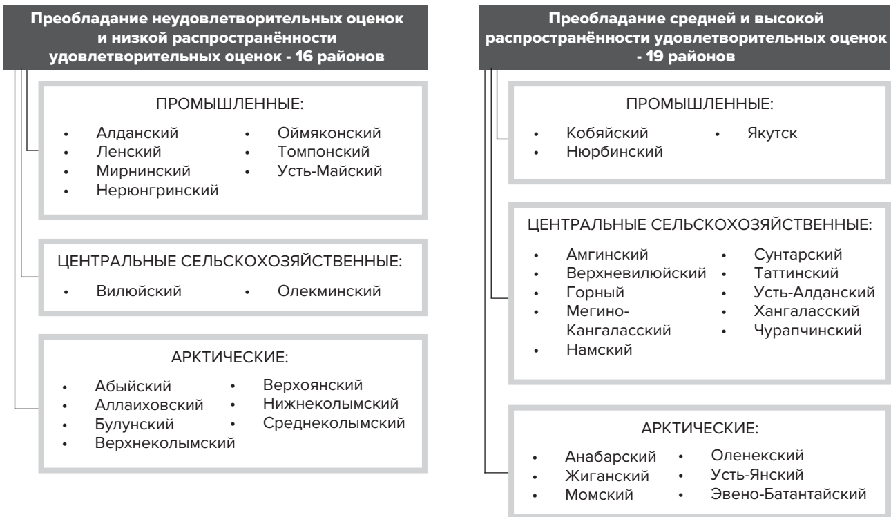
Рисунок 2. Распределение районов Республики Саха (Якутия) по уровню распространенности среди населения удовлетворительных оценок по изучаемым категориям социального самочувствия

ленной: в 19 районах 21 республики наблюдается превышение числа категорий с отрицательной динамикой за последние пять лет доли населения, оценивающего ситуацию удовлетворительно, в 14 – рост доли населения, удовлетворительно оценивающего ситуацию по категориям исследования, в 2 – стабильность; групповая специфика в разрезе специализаций не выделяется.